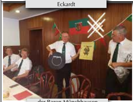
der Baron Münchhausen

Begrüßen wir dich das du 2020 wieder zu uns kommen wirst.